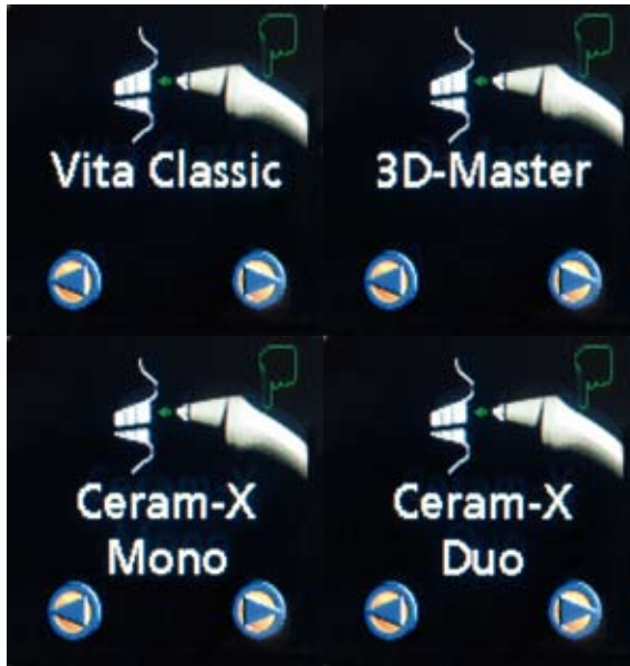
Abb. 5: Für die Anzeige der Messergebnisse stehen vier Farbsysteme zur Auswahl.

SYSTEM 3D-MASTER sowie Ceram-X Mono, sieben Farben (M1 bis M7) des Ein-Transluzenz-Systems des nano-keramischen Füllungsmaterials Ceram-X (Dentsply DeTrey, D-Konstanz), und Ceram-X Duo mit den Farbwerten des entsprechenden Zwei-