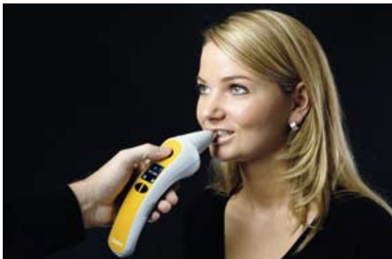
Abb. 6: Für die Farbmessung wird die Spitze des ShadeStar flach an den Zahn gehalten.

Transluzenzen-Systems (Abb. 5). Anschließend wird eine Einmal-Schutzfolie über das gesamte Gerät gezogen. Diese ist mit einem Loch für die Messspitze versehen. Für die Messung wird die flache Öffnung des Tubus parallel an den Patientenzahn gehalten, sodass sie flach anliegt, und dann die Messtaste gedrückt (Abb. 6). Die Auflagefläche sollte sich im oberen Teil beziehungsweise mittleren Drittel, d. h. dem farblich homogenen Bodybereich des Zahns befinden. So wird eine Verfälschung des Messergebnisses der