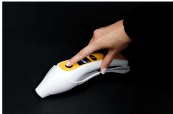
Abb. 4: Kalibrierung des Messgeräts durch Einsetzen in die Station und Betätigen der Messtaste.

gen der Messtaste wird die Kalibrierung ausgelöst. Nachdem diese abgeschlossen ist – der Zeitaufwand beträgt nur den Bruchteil einer Sekunde – wird im Display das Farbsystem VITAPAN Classical angezeigt. Dies steht an erster Stelle, da es das am meisten verbreitete ist. Zur Auswahl stehen zusätzlich das VITA