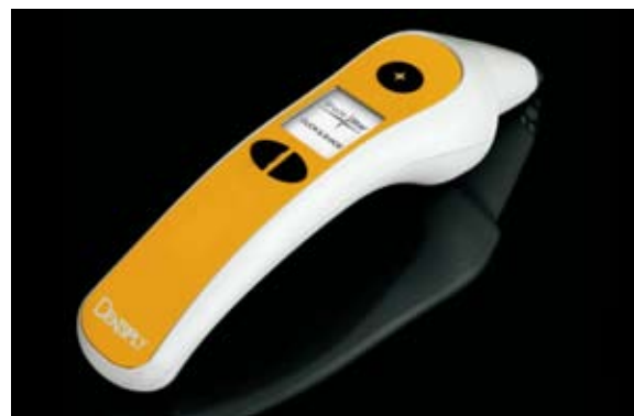
Abb. 2: Das Messverfahren des ShadeStar basiert auf der Kolorimetrie.

Im Gegensatz zum Shadepilot™ handelt es sich bei dem neuen ShadeStar (Abb. 2) nicht um ein Foto-