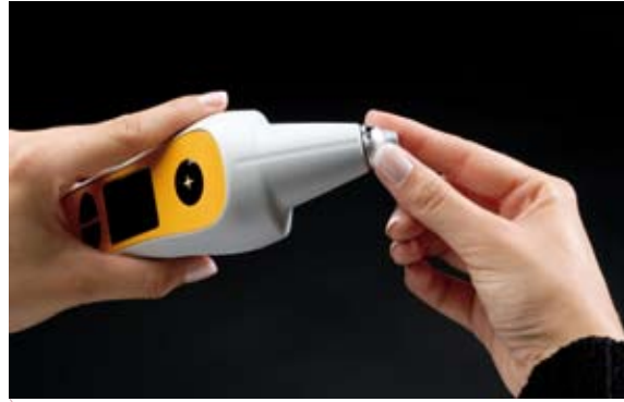
Abb. 3: Aufdrehen des Messtabus auf die Gerätspitze.

Für die Farbnahme mit dem ShadeStar wird zunächst einer der Einweg-Messtabusse auf die Gerätspitze aufgesetzt, durch eine Achteldrehung arretiert (Abb. 3) und das Gerät durch Drücken der Mess-taste eingeschaltet. Daraufhin erscheint der Startbildschirm und das Gerät wird in der Kalibrierstation positioniert (Abb. 4). Da die Eichung gemäß einer kleinen Keramikscheibe erfolgt, die sich in der Spitze der Station befindet, dürfen bei Vorhandensein mehrerer ShadeStars die Geräte und Stationen nicht beliebig untereinander vertauscht werden. Dies könnte Messfehler zur Folge haben. Durch erneutes Betäti-