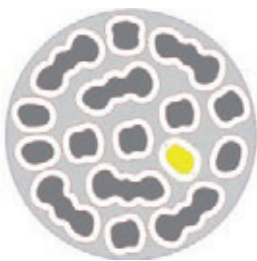
Nesting mit DentMILL.

Auf Grundlage der Konstruktionsdaten, die beispielsweise mit DentCAD erstellt wurden, richtet der CAM-Assistent von DentMILL die geplanten Restaurationen automatisch optimal im