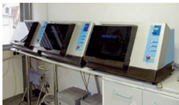
Die Fräseinheiten arbeiten auf Hochtouren.

pro Monat einen Scanner Cercon eye (DeguDent, Hanau) zur Verfügung. Der Betrag entfällt bei einer monatlichen Mindestabnahme von 21 Einheiten. Das Service-Paket umfasst auch die benötigten Software-Updates inklusive entsprechender Schulungen während der vierjährigen Vertragszeit. Die Datensätze der Konstruktionen werden von den Kunden via Internet oder USB-Stick an unser Labor gesendet. Durch zwei unterschiedliche E-Mail-Adressen werden die Daten der beiden Scanner-Systeme automatisch vorsortiert und anschließend auf die entsprechenden Fräsechner übertragen. Unser besonderer Service ist die Überprüfung und falls nötig Optimierung jeder einzelnen Konstruktion. Da Aufträge verschiedener Kunden aus einem Block gefräst werden, erfordert die Zuordnung der Arbeiten zu den entsprechenden File-Namen größte Sorgfalt. Wir garantieren eine 24-Stunden-Lieferung, denn die gefrästen Aufträge wer-