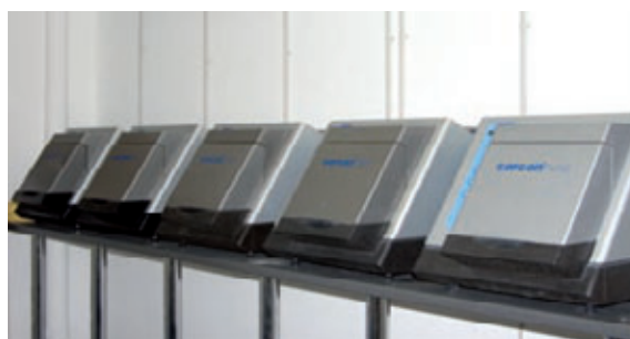
Die fünf neuen Öfen sollen erst der Anfang sein.

Die Kimmel Zahntechnik GmbH bezeichnet dieses Konzept, welches nicht nur CAD/CAM-Arbeiten, sondern auch Planungssysteme (SimPlant, Materialize, Leuven, Belgien) umfasst, als Basis eines wahren „Synergiecenters“, da das Leistungsangebot eine gegenseitige Förderung unter Laboren ermöglicht, aus welcher alle Beteiligten gestärkt hervorgehen. Mit dieser neuen Herangehensweise konnte ein „zweites Standbein“ geschaffen werden, dessen anfängliche Entwicklung die Geschäftsführer sehr optimistisch stimmt. Das flexible und umfassende Leistungsangebot sowie die Zusammenarbeit auf vertraglicher Grundlage sichern eine optimierte Kundenbindung und der Kundenstamm an sich konnte durch die Einbeziehung von Praxislaboren maßgeblich erweitert werden. Die „Synergie-Partner“ profitieren von der langjährigen Erfahrung in CAD/CAM-Verfahren, umfassendem Service und der Möglichkeit bei überschaubaren Kosten wirtschaftlich risikofrei Zahnversorgungen auf dem neuesten Stand der Technik anzubieten. Bei einem Preis von 69,- Euro pro Einheit profitieren beide Seiten.