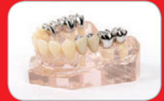
Suntech LIGHT® Brücke mit großer Spannweite