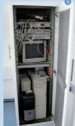
Nur mithilfe einer fundierten und exakt geplanten IT-Struktur ist eine optimale Nutzung digitaler Technologien in Praxis und Labor möglich. Dieser Beitrag soll als Leitfaden bei der Planung dienen.