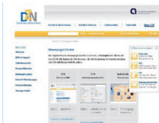
Abb. 4: Das Homepage-Center des DZN.

Für 7,90 Euro zusätzlich pro Monat kann das Mehrwertpaket MT gebucht werden, um zahlreiche weitere Angebote zu nutzen. Über die Rubrik Homepage-Center kann ein sogenanntes Praxisschild, d. h. eine Visitenkarte für das Web erstellt werden. Außerdem können Vorlagen für die Erstellung einer eigenen Website genutzt werden. Die Vorlagen geben Raum für eine Beschreibung des Leistungsspektrums, die Anfahrsbeschreibung etc. Über einen FTP-Zugang kann auch eine individuelle Website an den Host des DZN überstellt werden. Der Speicherplatz ist inklusive.