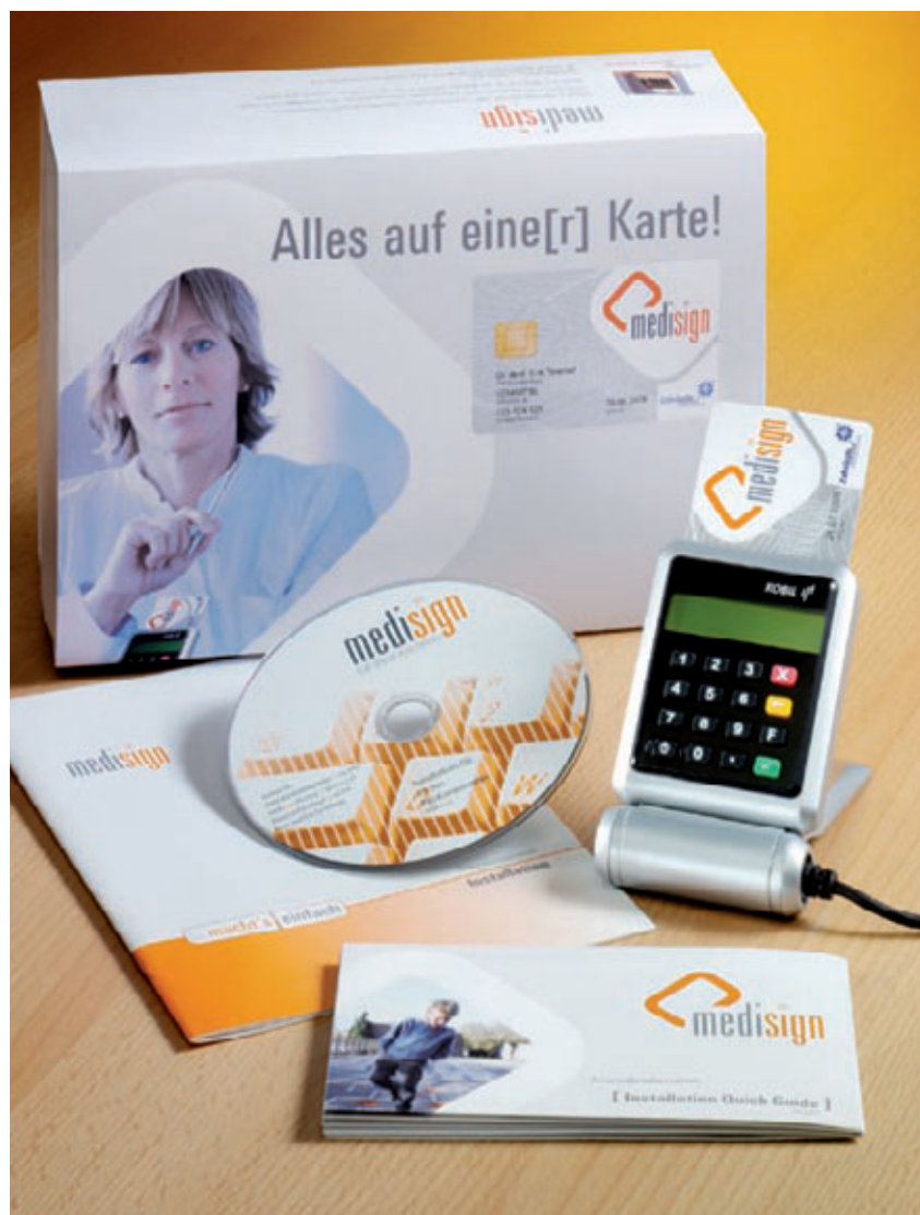
Abb. 6: Die medisign ZOD Card kann u. a. für die Online-Abrechnung genutzt werden.

DGN Service GmbH Niederkasseler Lohweg 181-183 D-40547 Düsseldorf Tel. +49 (0) 2 11 / 7 70 08-333 kontakt@dgnservice.de www.dgnservice.de