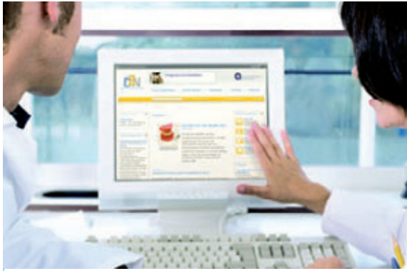
Abb. 2: Das DZN (Deutsches Zahnarzt-Netz) wurde speziell auf die Bedürfnisse von Zahnärzten ausgerichtet.

Die Intranet-Plattform DZN (Deutsches Zahnarzt-Netz) ist seit 2001 online und das bislang einzige Intranet-Portal speziell für Zahnärzte ( www.dzn.de ). Es ist nicht frei zugänglich, sondern die Kunden