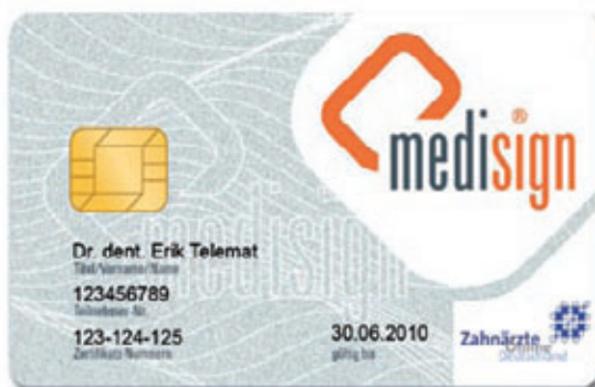
Abb. 5: Die Signaturkarte medisign ZOD Card.

Im hauseigenen Trustcenter der dgnservice werden Signaturkarten zur Authentifizierung, Verschlüsselung und digitalen Signatur erstellt. Die „medisign ZOD Card“ ist eine Chipkarte speziell für Zahnärzte, die für verschiedene Einsatzgebiete genutzt werden kann, die in Zukunft noch weiter ausgebaut werden.